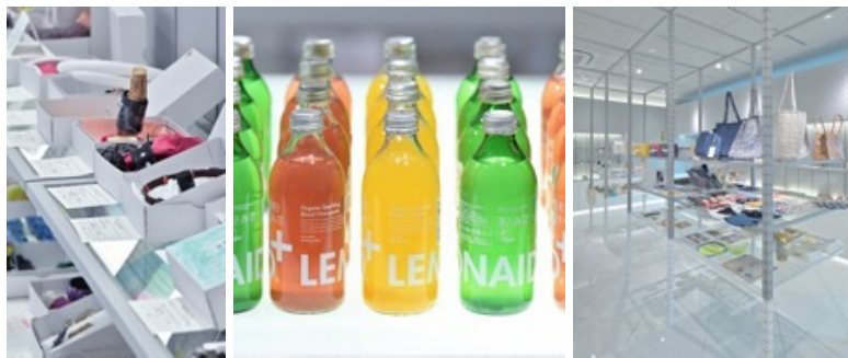
haishop 渋谷スクランブルスクエア (2021年6月～2022年2月)