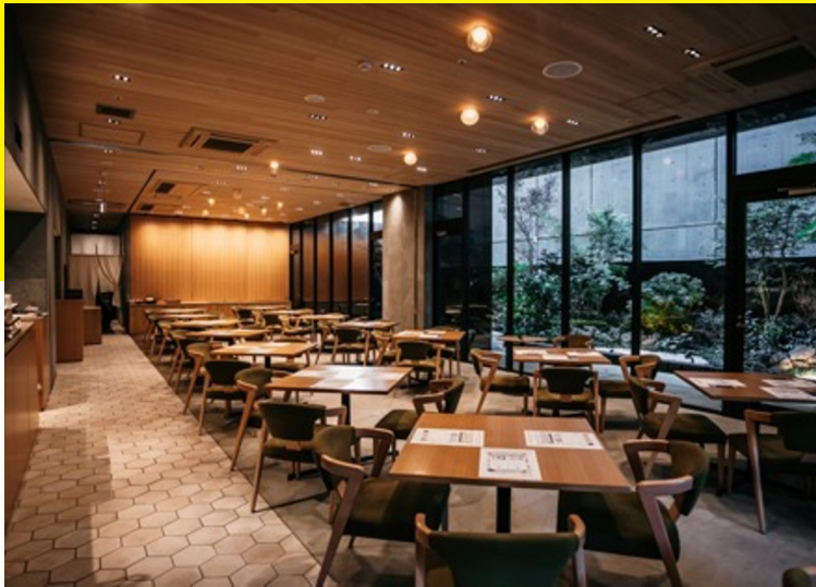
KIGI | 東京 溜池山王 (2019年3月～)