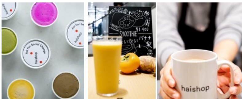
haishop cafe 渋谷スクランブルスクエア (2022年9月～)