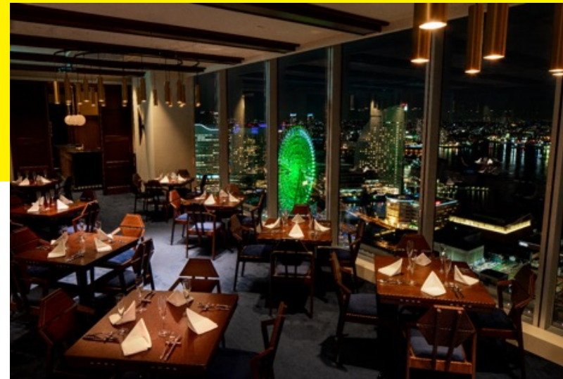
KITCHEN MANE | 横浜 みなとみらい (2019年9月～)