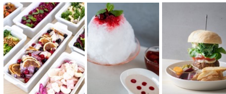
haishop cafe 横浜 (2019年9月～2024年12月)